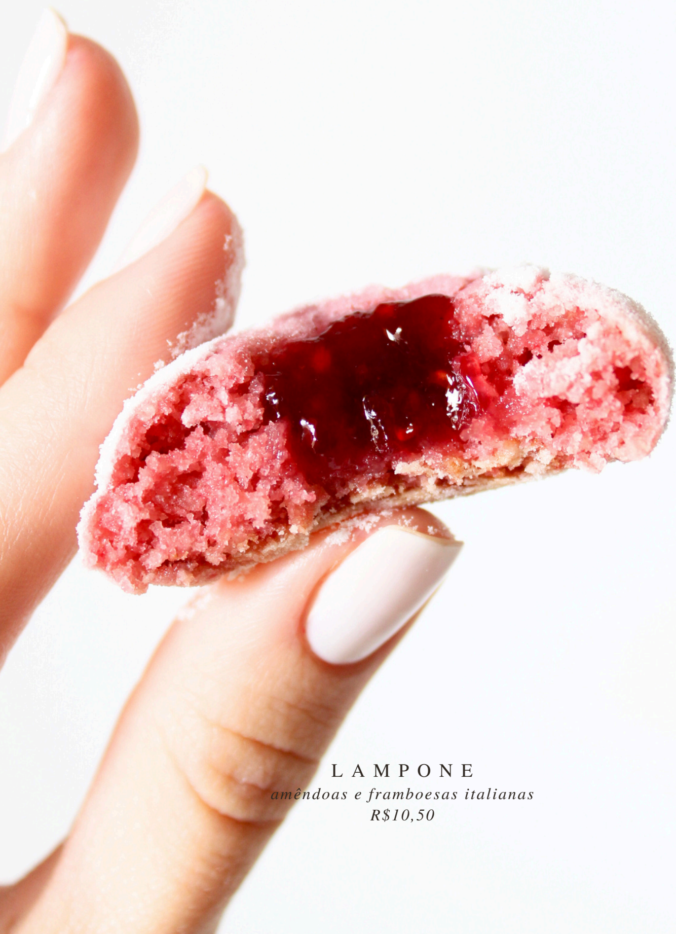
LAMPONE amêndoas e framboesas italianas R$10,50